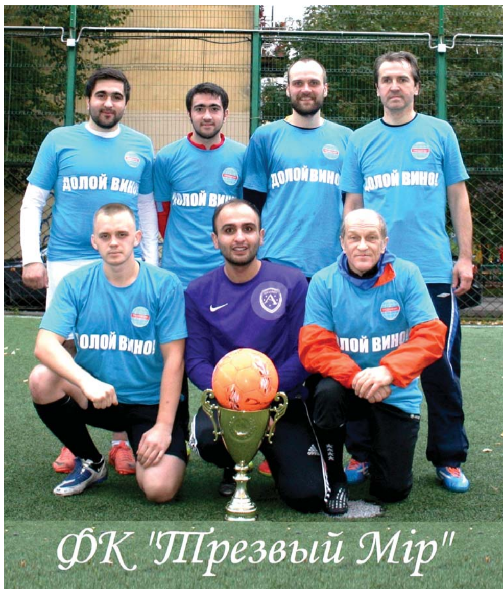
ФК "Трезвый Мир"