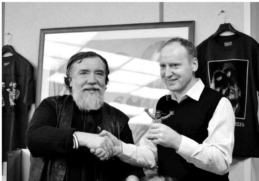
Первый лот уже ушёл! Статуэтка Митька работы Дмитрия Шагина куплена за 50 тысяч рублей

Будем честны — алкоголизм одна из самых страшных болезней России. Под Петербургом есть сообщество, которое помогает людям выкарабкаться из объятий этого недуга. Единственное, что давит: «Дом надежды на Горе» постоянно находится под угрозой закрытия. Причина — не хватает средств, ведь лечение бесплатное. Очередная попытка закрыть финансовые бреши — проведение электронного аукциона вещей, подаренных известными петербуржцами, стартовавший 13 марта 2018 года.