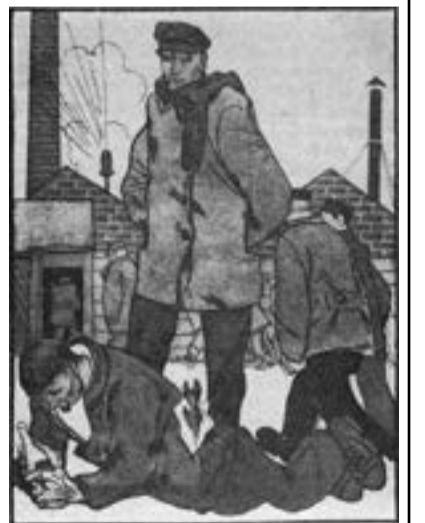
– Встань, товарищ. К социализму не дойдешь на четвереньках. Рис. М. Черемных («Крокодил» 1929 г.)

И как тот, кто пережил кровавую войну, восклицает: «Долой войну!» – так я кричу: «Долой алкоголь! Не отравляйте молодые жизни этим ядом!» Единственный способ прекратить войну – перестать воевать. Единственный способ прекратить пьянство – перестать продавать алкоголь. Китай прекратил всеобщее курение опиума, запретил выращивать его и ввозить в страну. Все философы, священники и врачи могли бы тысячу лет до хрипоты твердить о вреде опиума, но, пока яд был доступен, курение его продолжалось. Такова уж человеческая природа!