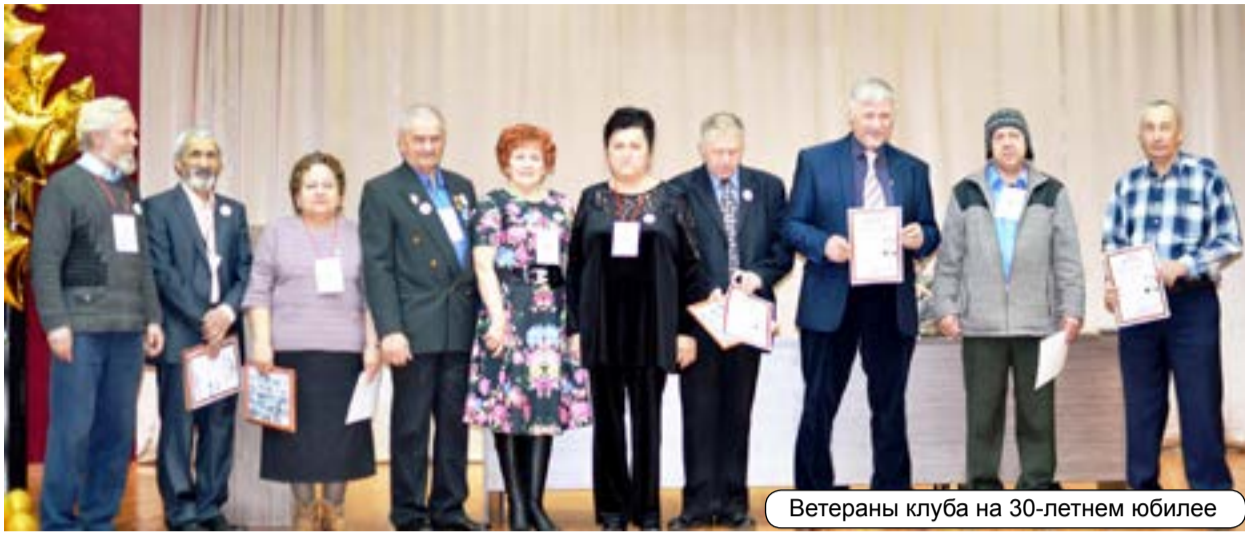
Ветераны клуба на 30-летнем юбилее

В августе, в Доме Техники Нижнекамска, выпускники 1-ой и 2-ой