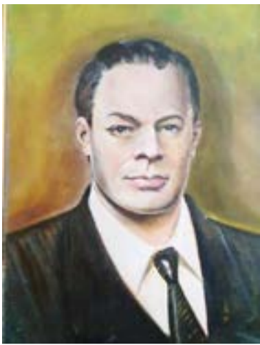
18 мая день рождения Геннадия Андреевича Шичко — наш праздник Трезвости

Спиртными напитками называются напитки, содержащие этиловый или винный алкоголь. Этот алкоголь еще называют спиртом или, что правильнее, этанолом. Его химическая формула — C_2H_5OH . Фармакологи относят этанол к наркотическим веществам, поскольку он по особенностям действия на человека сходен с эфиром, хлороформом, морфином и другими наркотиками. Алкогольные напитки получают при спиртовом брожении сахаристых веществ. Брожение же представляет собой распад сложных органических соединений под влиянием микроорганизмов, дрожжей, которые широко распространены в природе. Они, например, обитают на виноградных ягодах, поэтому виноградный сок способен к самосбраживанию и превращению в вино. Отсюда понятно, почему этот напиток стал известен людям примерно 10 тысяч лет назад. Вообще же опьяняющие напитки человек научился производить еще раньше, одним из подтверждений чего могут служить наблюдения нашего отважного ученого Н.Н. Миклухо-Маклая за жизнью папуасов, пребывавших в то время в каменном веке. Папуасы не умели добывать огонь и делать одежду, но обладали способом приготовления хмельного напитка. Способ был прост: разжевывали растение кеу, обильно смачивая его слюной, руками отжимали жвачку так, что жидкость стекала в скорлупу кокосового ореха, её обычно смешивали с небольшим количеством воды и давали постоять некоторое время. В результате получался очень горький и сильно пьянящий напиток кеу.