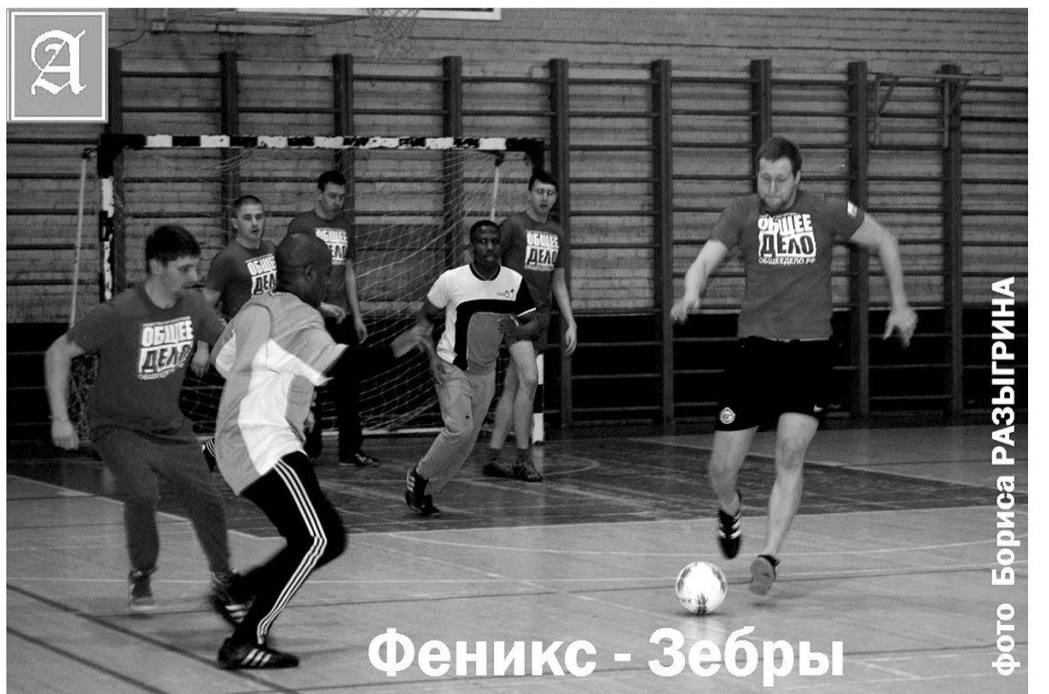
Феникс - Зебры