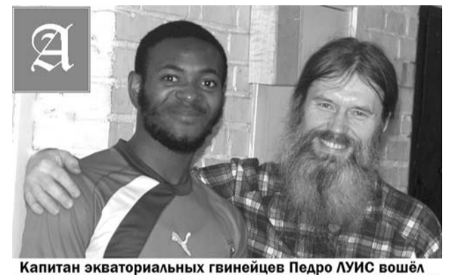
Капитан экваториальных гвинейцев Педро ЛУИС вошёл в историю как автор перевода Обвинительного приговора Разума пьянству на язык народа фанг.