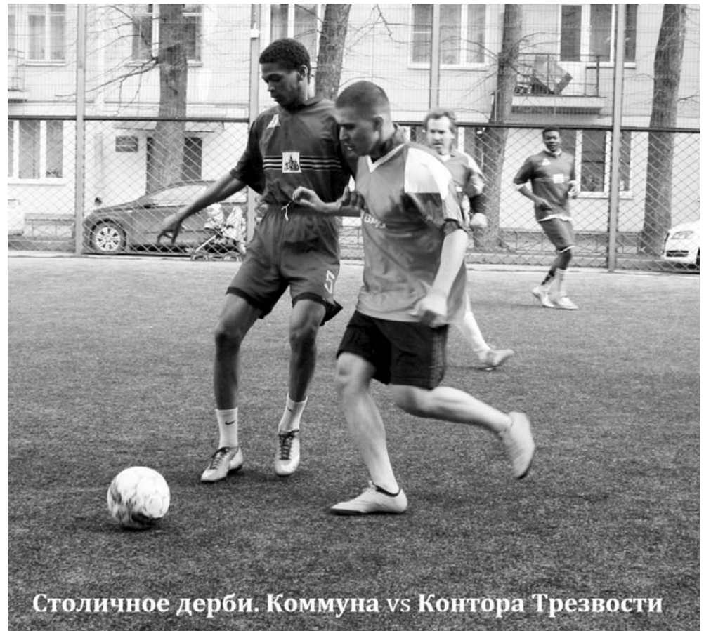
Столичное дерби. Коммуна vs Контора Трезвости